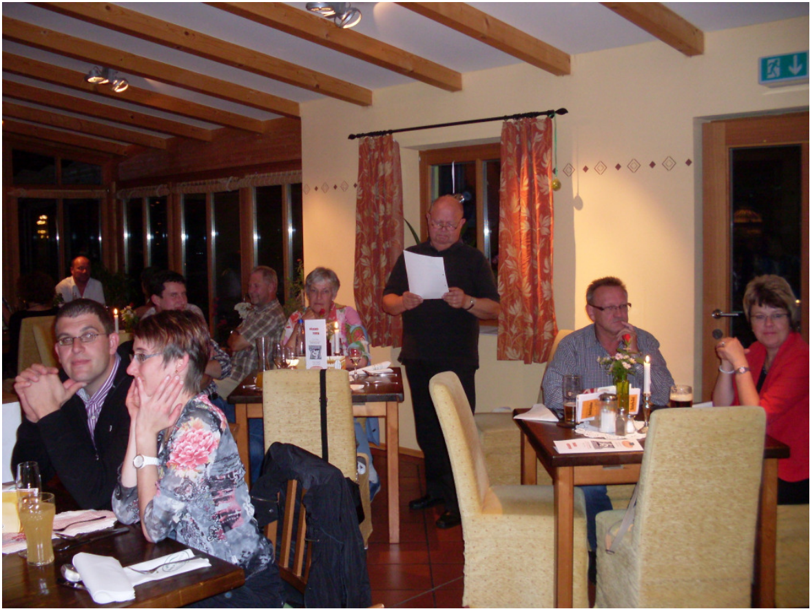
Bilder von der Lesung